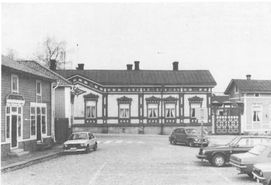
Marela - Laivanvarustajan koti. Museo Raumalla. Kuva seuran kevätretkeltä

Jumala ei voi muuttaa mennyttä, mutta historian- tutkijat voivat.