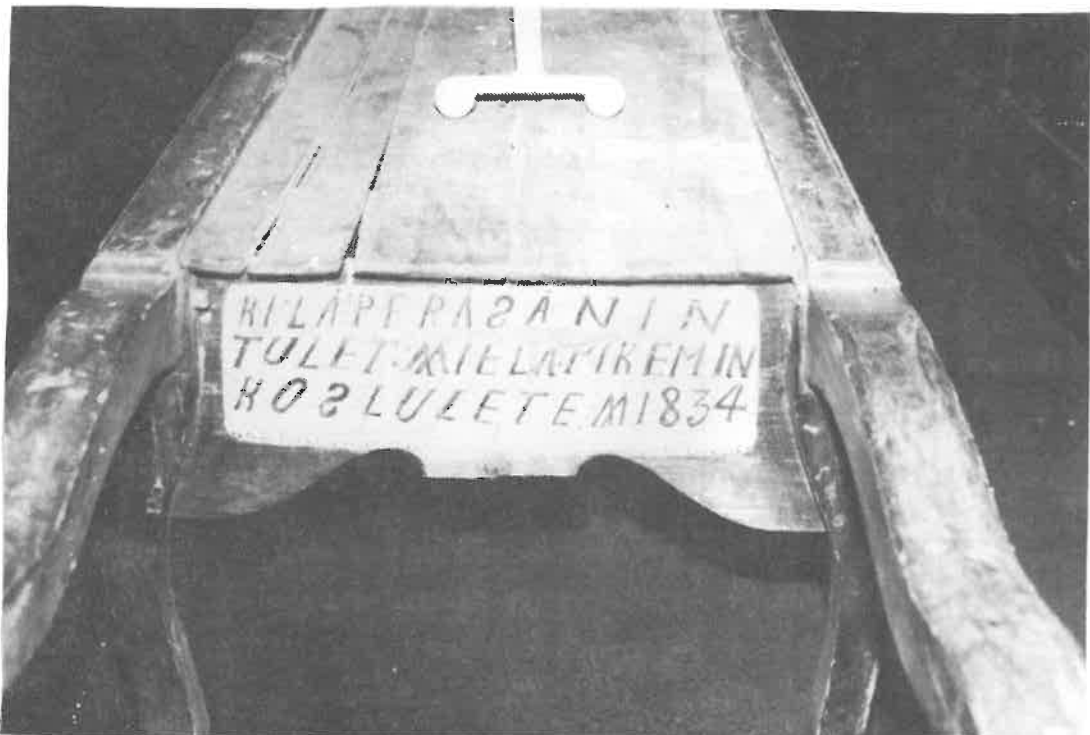
Sastamalan Vanhan Kirkon eli Pyhän Marian kirkon ruumispaarit. Päädyssä on teksti "KYLÄ PERÄSÄNIN TULET. WIELÄ PIKEMIN KOS LULETE W 1834".

Kuva seuran kevätretheltä 1985 - Pasi Kuusiluoma